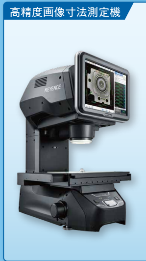
高精度画像寸法測定機