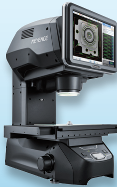
高精度画像寸法測定機